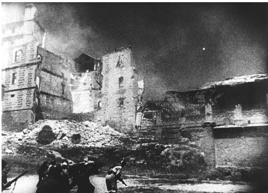
L'assedio dell'Alcazar/Sin novedad en el Alcázar (Augusto Genina, 1940)

cracia. Para esta restauración no terminada se realizó un trabajo de recopilación de datos que permitió establecer el grado de manipulación de las diversas copias localizadas, pero aún no sabemos cómo era la versión original de la película.