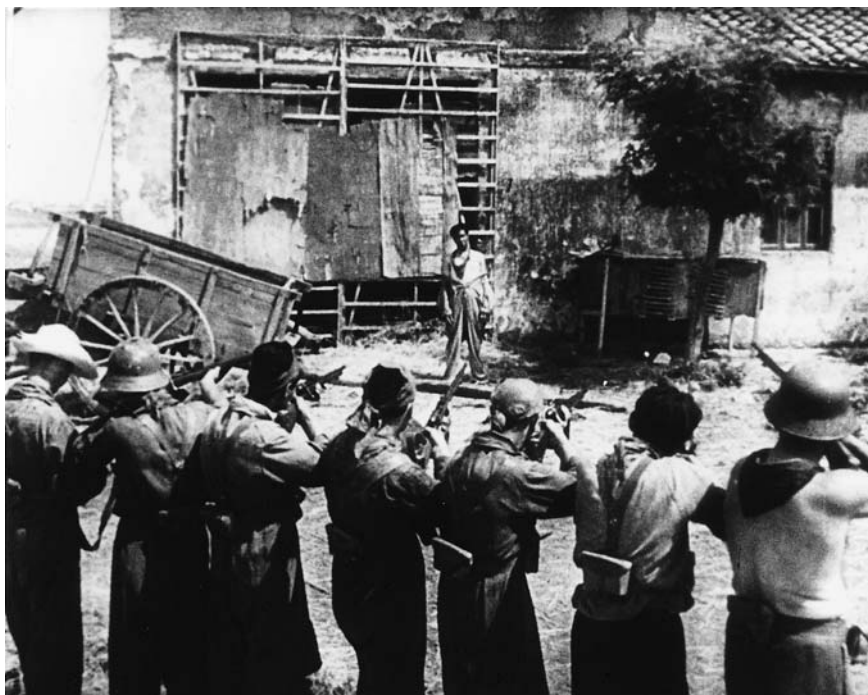
L'assedio dell'Alcazar/Sin novedad en el Alcázar (Augusto Genina, 1940)

en esta fecha llega a España el material para proceder al doblaje de la versión española. Sin novedad en el Alcázar se rodó en doble versión. De cada plano se hacían dos tomas: una en la que los actores decían el diálogo en italiano, y otra en la que lo hacían en español. Los actores eran los mismos y además en ninguna de las dos versiones se tomaba sonido directo, por lo que la doble versión únicamente estaba justificada por el ajuste de la dicción de los actores al doblaje posterior. Los negativos de ambas versiones se procesaron en los laboratorios de Cinecittà, donde también se tiraron las primeras copias para la exhibición. El único trabajo técnico de la película realizado en España fue el doblaje de la versión española. El hecho de que se rodara una versión específicamente destinada a la distribución en España refuerza la idea de que se trata de una coproducción entre Italia y España. Si se tratase de una producción enteramente italiana, sería impensable que el productor costease un doble rodaje, el distribuidor español se hubiera limitado a adquirir un contratipo y doblarlo, como se hacía con cualquier película de nacionalidad no española.