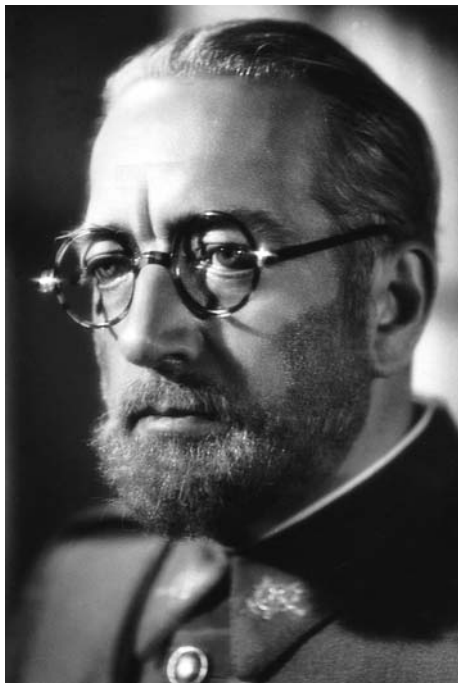
L'assedio dell'Alcazar/Sin novedad en el Alcázar (Augusto Genina, 1940)

desde Italia se eligiese precisamente este episodio como base de un proyecto que pretendía exaltar los valores morales de un bando frente al otro. Resulta más difícil de entender el valor propagandístico de la película en España, la calificación de los dos bandos es tan simple y la referencia temporal tan cercana que su poder de convicción para un público español debería ser escaso. Sin embargo, si se observa como una operación destinada al exterior, el interés del régimen franquista resulta de todo punto lógico. De cualquier manera, Sin novedad en el Alcázar es un ejemplo claro de la propaganda cinematográfica en los regímenes totalitarios, que no se basa en los mecanismos de persuasión o de seducción, como en los países democráticos, sino en el miedo, en la demostración de potencia. Lo que podían ver los españoles en la película no era una historia que les convenciese de que los hechos fueron de determinada manera, sino la posición de los vencedores frente a esos hechos.