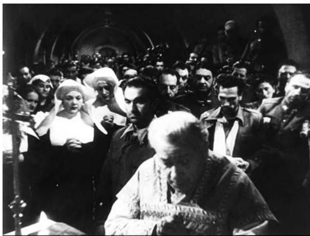
L'assedio dell'Alcazar/Sin novedad en el Alcázar (Augusto Genina, 1940)

mendi y de la Legión, en la película producida por Vd. titulada Sin novedad en el Alcázar , tengo el honor de poner en su conocimiento que deberá efectuar la inclusión de diferentes trozos musicales de los mencionados himnos en la película de referencia. Todo ello no implicará pago de derechos de autor, toda vez que por ser dicho motivo con fines patrióticos se ha recabado la exención de derechos." La fecha es posterior a la presentación de la película en Venecia, y esa "orden de la superioridad" que se menciona y el tono imperativo de la nota parecen indicar que la